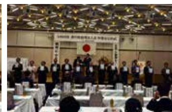
辞令交付 香川県役職者