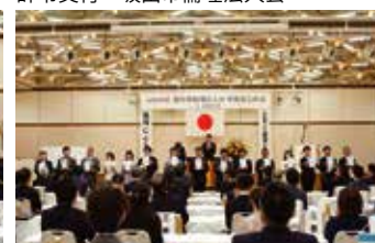
辞令交付 高松南倫理法人会