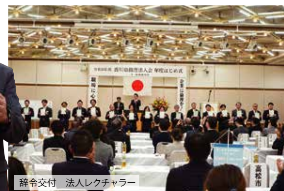
辞令交付 法人レクチャー