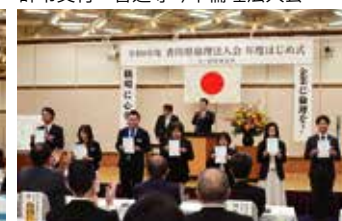
辞令交付 高松三木倫理法人会