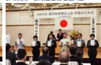
辞令交付 高松中央倫理法人会