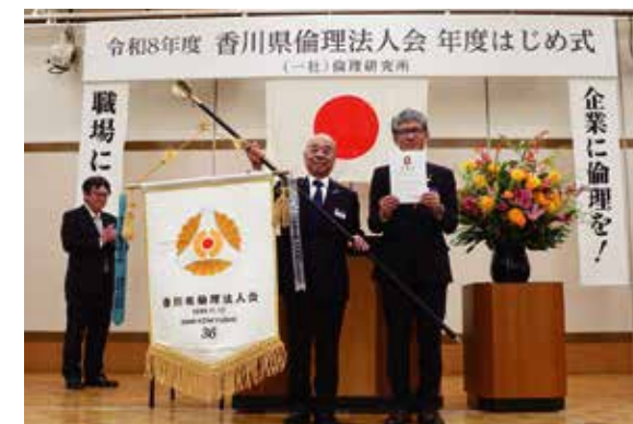
新会長へ「倫理法人会旗」の引き継ぎ