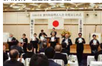
辞令交付 高松市倫理法人会