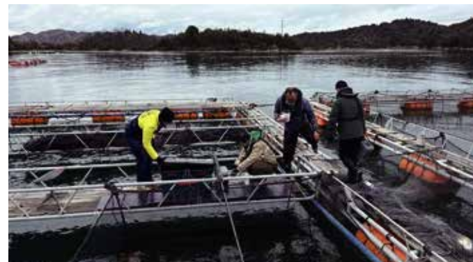
▲直島での「養殖業のAI、IoT化」実証事業の様子

結果的には、3人とも亡くなってしまったのですが、その年のクリスマス夜の夜、仕事から帰ると、妻と子供たちが、「パパ今年1年大変だったね。いろいろあったけどクリスマス位は笑って過ごそう」と手作りの料理をたくさん作ってくれていました。妻や子ども達の方が私よりよっぽど大変な1年だったにも関わらず、私のためにこんな事をしてくれて、本当に「家族の大切さ」を実感し、「感謝」の気持ちがあふれてきました。