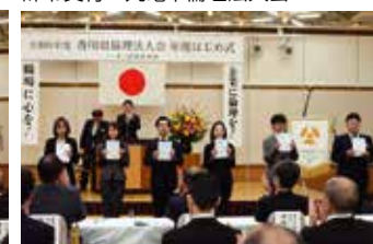
辞令交付 讃岐富士倫理法人会