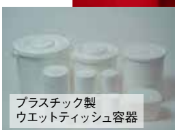
プラスチック製ウエットティッシュ容器