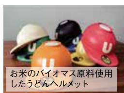
お米のバイオマス原料使用したうどんヘルメット