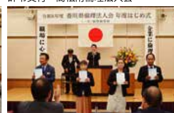
辞令交付 東かがわ市倫理法人会