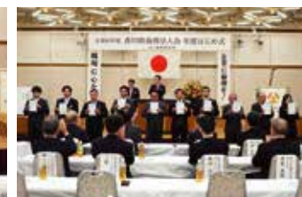
辞令交付 丸亀市倫理法人会