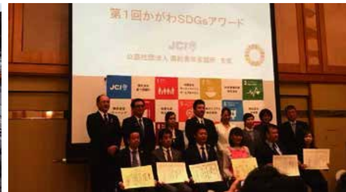
▲第1回かがわSDGsアワード「高松市長賞」