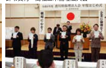
辞令交付 さぬき市倫理法人会