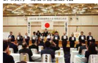
辞令交付 高松東倫理法人会