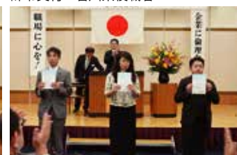
辞令交付 坂出市倫理法人会