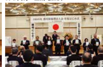
辞令交付 普通寺琴平倫理法人会