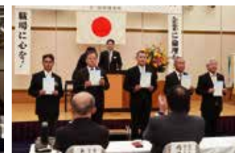
辞令交付 正副地区長