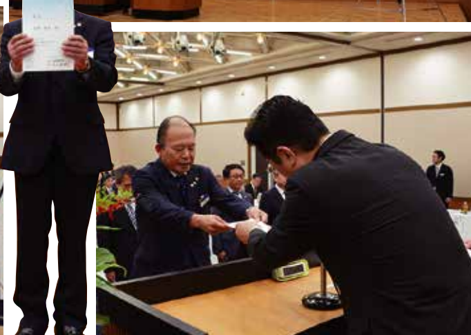
辞令交付 香川県役職者