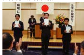
辞令交付 三豊倫理法人会