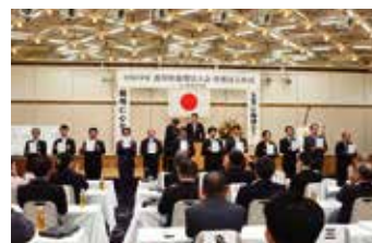
辞令交付 香川県役職者