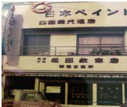
▲松田敏商店四国出張所として創業

当時は、「職場の教養」は使っているものの、純粋倫理の内容については不勉強であり、人に勧めるのもうまく説明できない状況でありました。