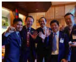
▲モーニングセミナー後の朝食会にて