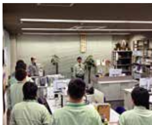
▲先代から引き継いだ活力朝礼を実施