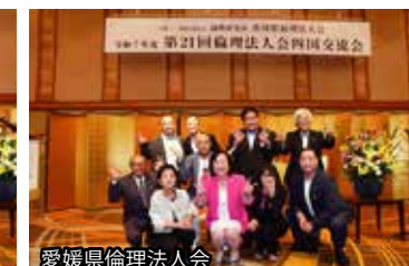
愛媛県倫理法人会