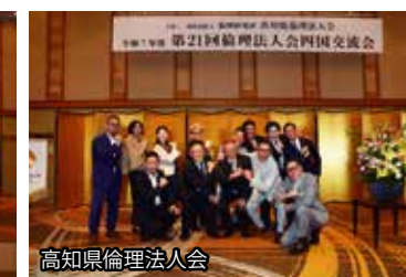
高知県倫理法人会