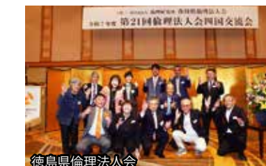
徳島県倫理法人会