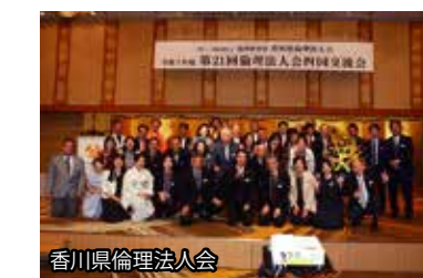
香川県倫理法人会