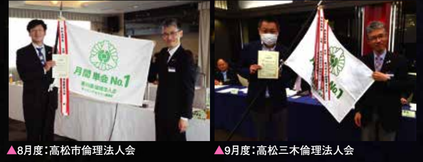
▲8月度:高松市倫理法人会