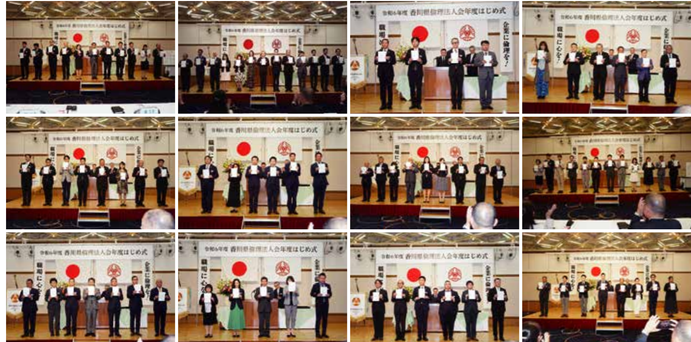
▲辞令交付 香川県役職者・正副地区長・単位倫理法人会役職者