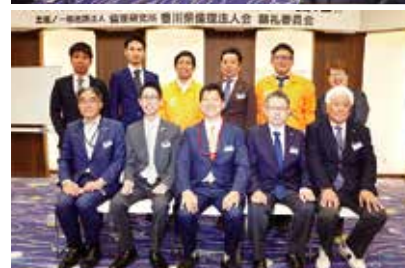
▲朝礼委員会スタッフ