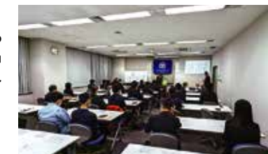
▲モーニングセミナー会場風景