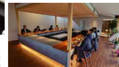
▲高松中央名物 おしゃれな朝食会 モーニングセミナーで学んだ後は、講話者を囲んでおしゃれな空間でおいしい朝食。みなさんも是非、ご体験ください。