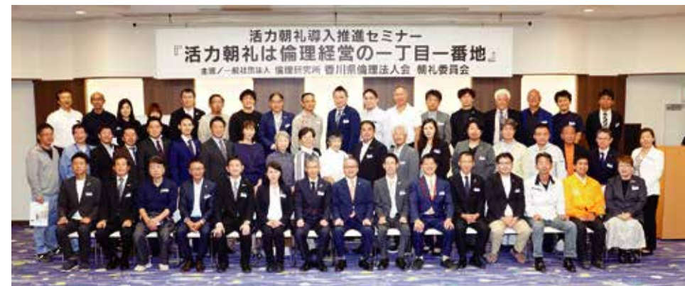
▲参加者全員で記念撮影