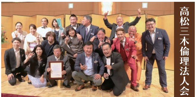
高松三木倫理法人会