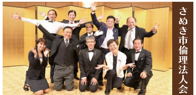
さぬき市倫理法人会