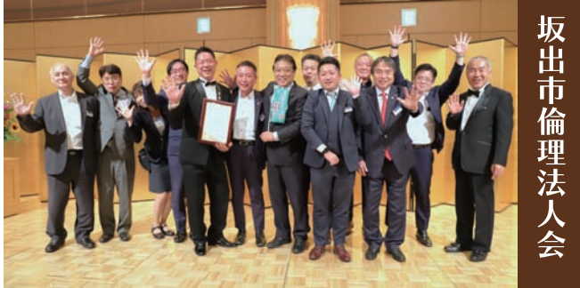
坂出市倫理法人会