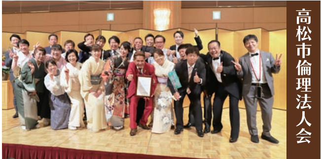
高松市倫理法人会