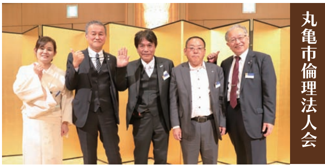
丸亀市倫理法人会