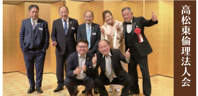
高松東倫理法人会