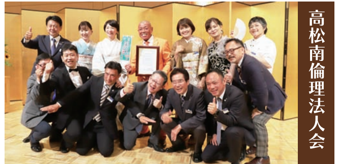
高松南倫理法人会