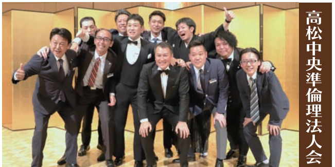
高松中央準倫理法人会