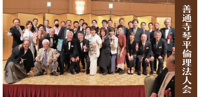
善通寺琴平倫理法人会