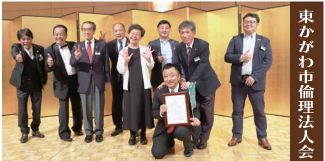
東かがわ市倫理法人会