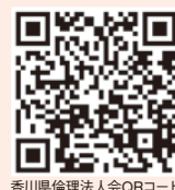
香川県倫理法人会QRコード