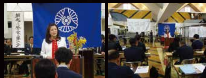
香川県高松東倫理法人会モーニングセミナー 平成29年3月15日(水)