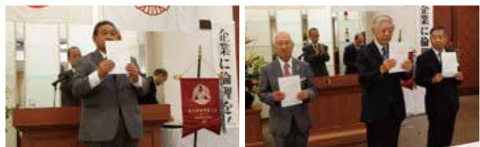
▲会長辞令 ▲法人アドバイザー辞令

その後、「平成28年度行事・会計監査報告」「懇親会」を実施。役員が一堂に会しその決意をいっそう明確にするための節目となった。