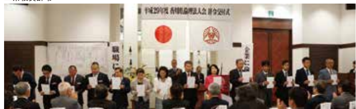
▲法人レクチャー辞令