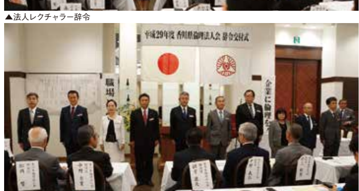
▲単会会長決意表明