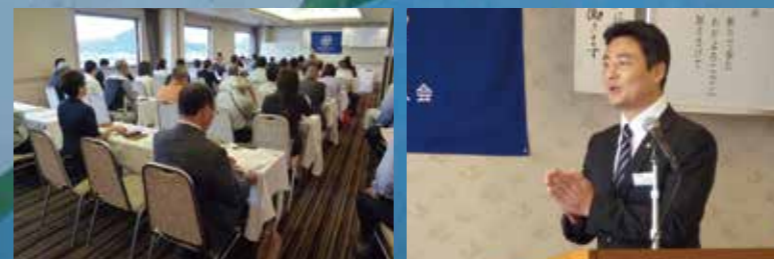
香川県丸亀市倫理法人会モーニングセミナー 平成28年8月5日(金)