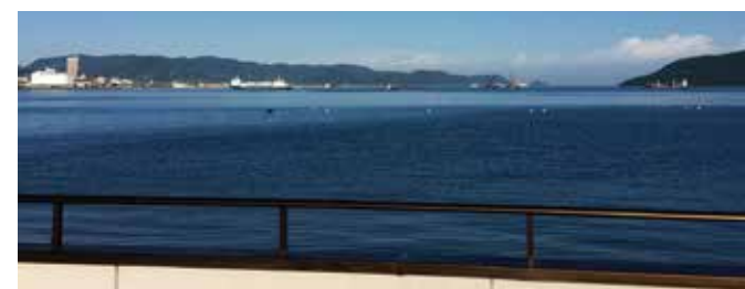
▲事務所ベランダからの眺め

業務としましては飲食店の調理環境の向上や、お客様にお出しする揚げ物の食味向上に合わせて経済効果目的の『からっとヘルシー君』、事業所や家庭の環境向上目的の『うずパワーシリーズ』、個々の健康管理に関する習慣の向上目的の『ダブル水素ボトル』等で各種環境改善のお手伝いを致しております。