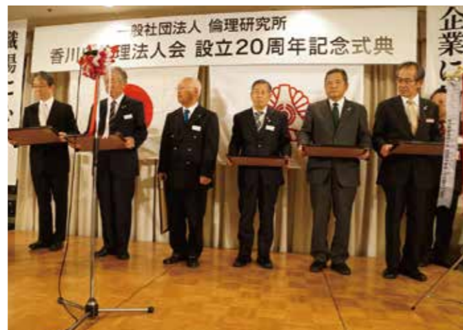
▲歴代の会長に感謝状