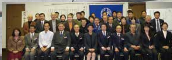
香川県普通寺琴平倫理法人会モーニングセミナー 平成28年2月6日(土)