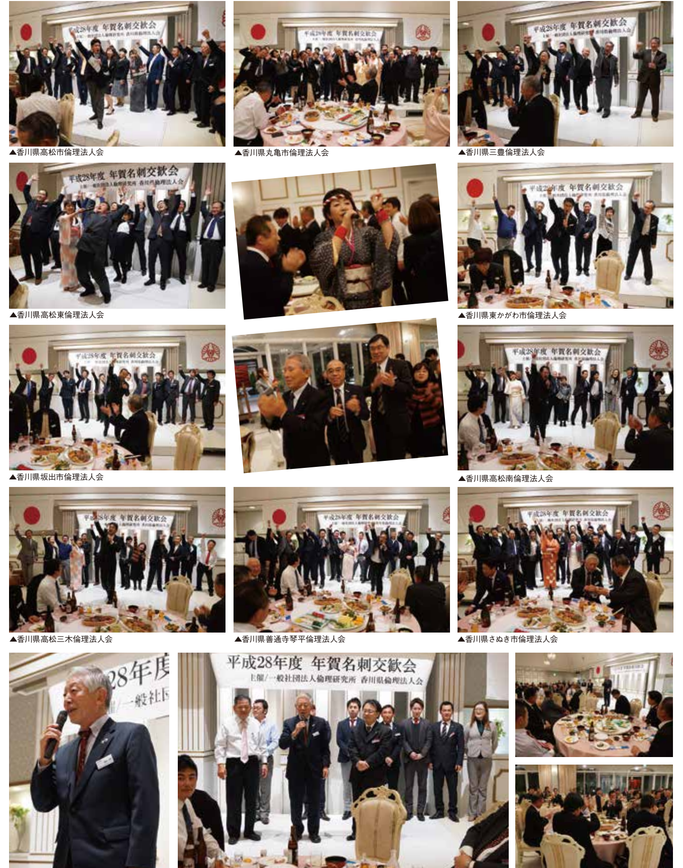
▲香川県高松市倫理法人会