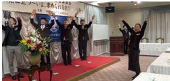
▲「朝礼実演」企業を元気に

目標数110名に対し、133名の出席があり、未会員 22社 31名でした。熱の覚めないうちに普及訪問し、倫理経営講演会開催後、会員の士気が高いうちに活動を行うことにより、早期達成を目指したいです。