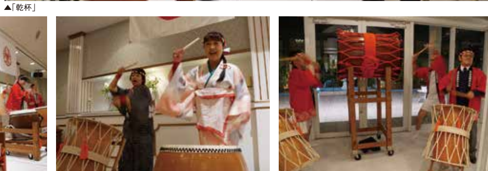
▲女性委員会「太鼓披露」