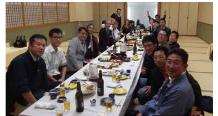
▲モーニングセミナー後、残って頂いた皆さん。経営者の集い後の懇親会(この時間帯嵐の真っ最中...)