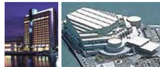
▲グランヴィリオ ▲アスティ徳島

懇親会では、アトラクションとしてプロの阿波踊りチームが演舞され、壇上では各県代表が阿波踊りを学び披露し大盛り上がり。県を越えて、あちこちで熱心に交流・意見交換されていて有意義な四国交流会となりました。