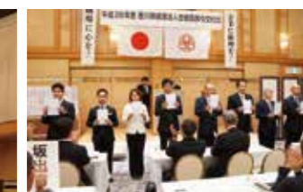
▲香川県高松市倫理法人会