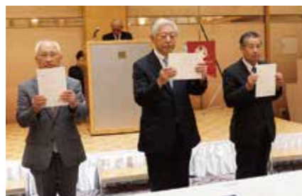
▲法人アドバイザー辞令