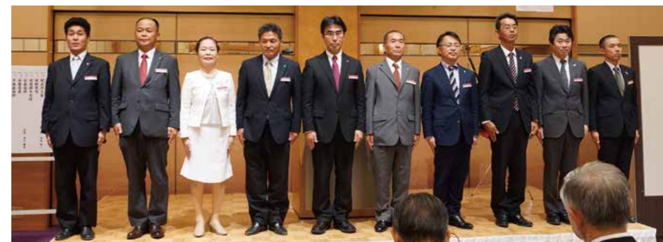
▲単会会長決意表明