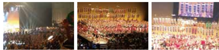
▲選抜阿波踊り大会前夜祭