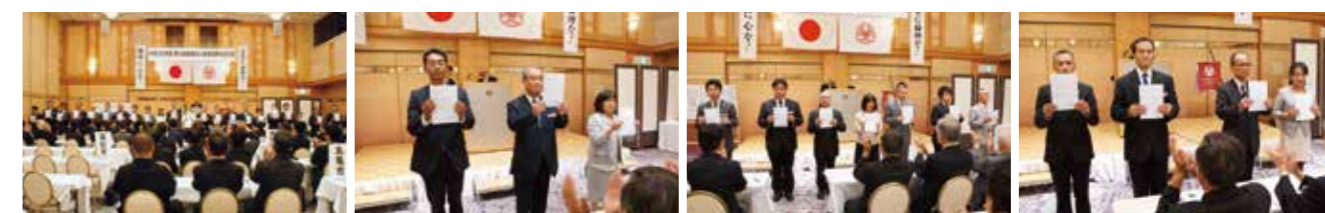
▲香川県高松南倫理法人会 ▲香川県高松三木倫理法人会 ▲香川県普通寺琴平倫理法人会 ▲香川県さぬき市倫理法人会