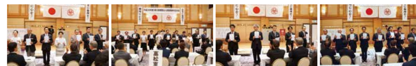
▲香川県三豊倫理法人会 ▲香川県高松東倫理法人会 ▲香川県東かがわ市倫理法人会 ▲香川県坂出市倫理法人会