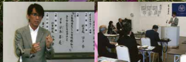
香川県高松三木倫理法人会モーニングセミナー 平成27年10月27日 (火)