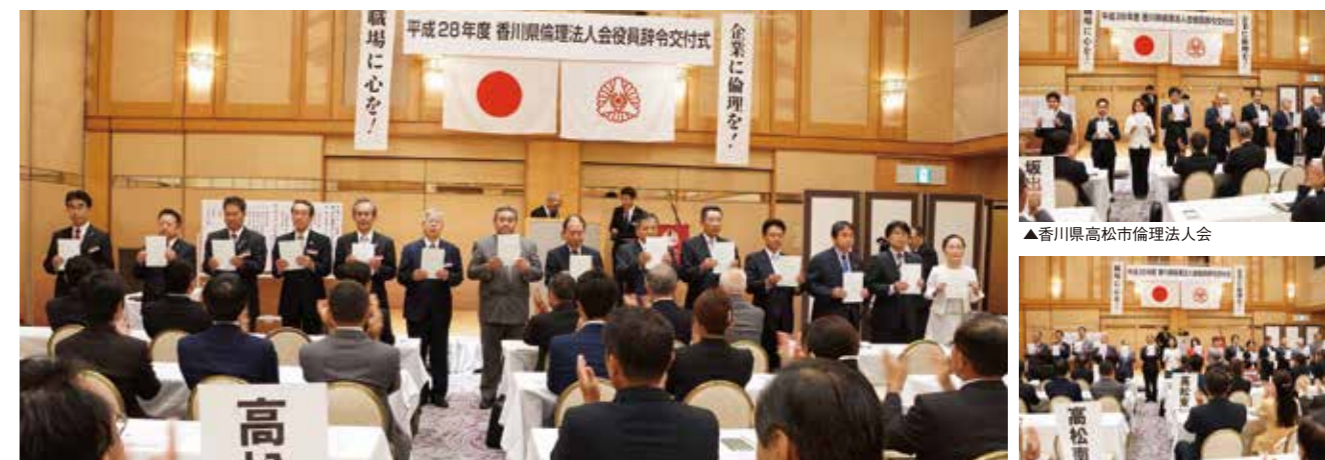
▲法人レクチャー-辞令