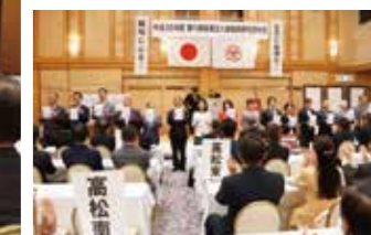
▲香川県丸亀市倫理法人会