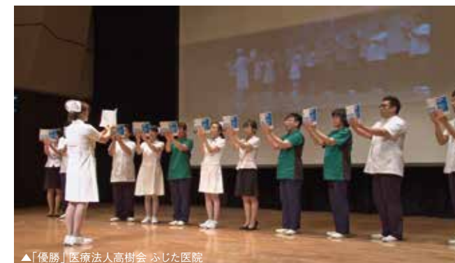
▲「優勝」医療法人高樹会 ふじた医院

出場企業は5チーム、これに香川県倫理塾第一期生のチームが加わり、活力あふれる独創的な朝礼を披露した。審査の結果、優勝の栄冠は 医療法人高樹会 ふじた医院。前回準優勝から見事にリベンジをはたし、優勝となった。2位