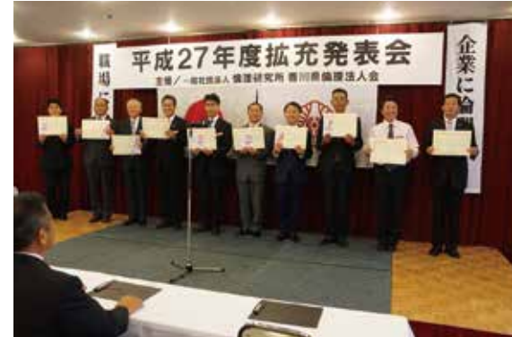
▲朝礼コンテスト発表 優勝は丸亀市倫理法人会、2位は高松南倫理法人会、3位は高松東倫理法人会でした。