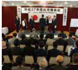
▲役員朝礼コンテスト