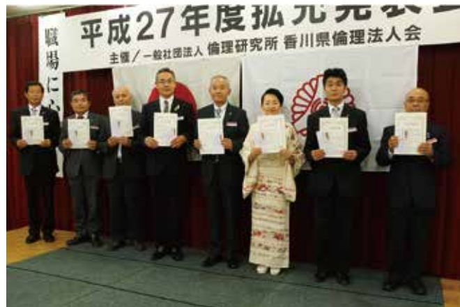
▲純増賞の受賞単会