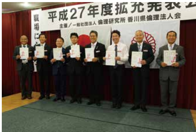
▲目標達成賞の受賞単会