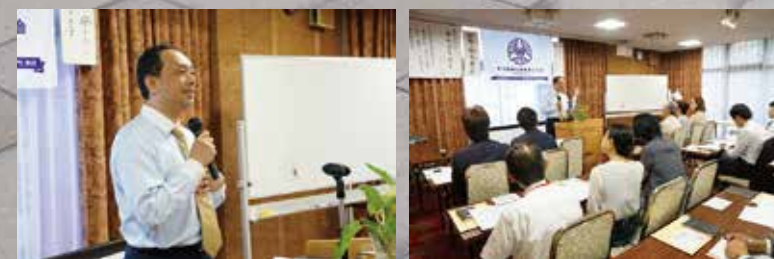
香川県高松南倫理法人会 モーニングセミナー 平成27年8月6日(木)