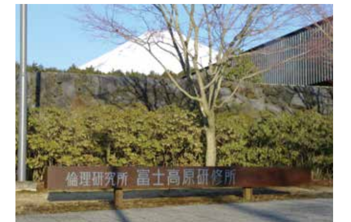
(有)大成造園(香川県高松南倫理法人会) 北谷 勇雄

この富士研の2泊3日で学んだ貴重な体験を、毎日の生活の中に取り入れて、家庭・職場と自分自身が実践して、周りの模範と成れる様努力して日々感謝して生活を送っております。最後にこの研修のチャンスを頂いた事を、こころより感謝申し上げます。また、この富士研修の素晴らしさをまだ体験して無い友人にも、広めて行きたいと考えております。ありがとうございました。