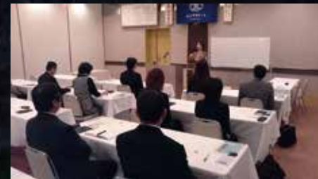
香川県坂出市倫理法人会 モーニングセミナー 平成27年4月1日(水)