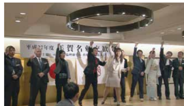
▲香川県坂出市倫理法人会