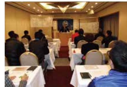
香川県東かがわ市倫理法人会 モーニングセミナー 平成26年12月16日(火)