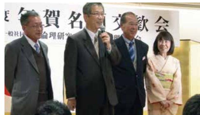
▲香川県三豊倫理法人会