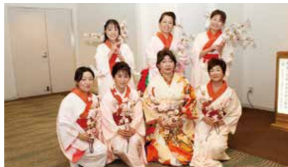
▲香川県倫理法人会女性委員会