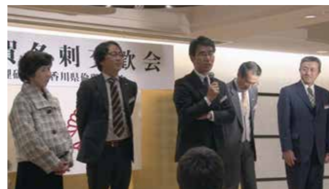
▲香川県東かがわ市倫理法人会