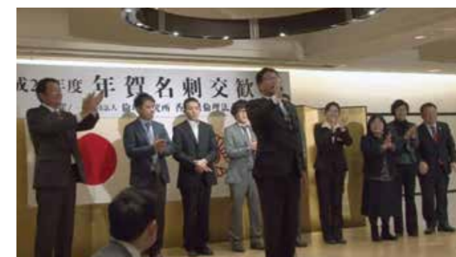
▲香川県高松三木倫理法人会