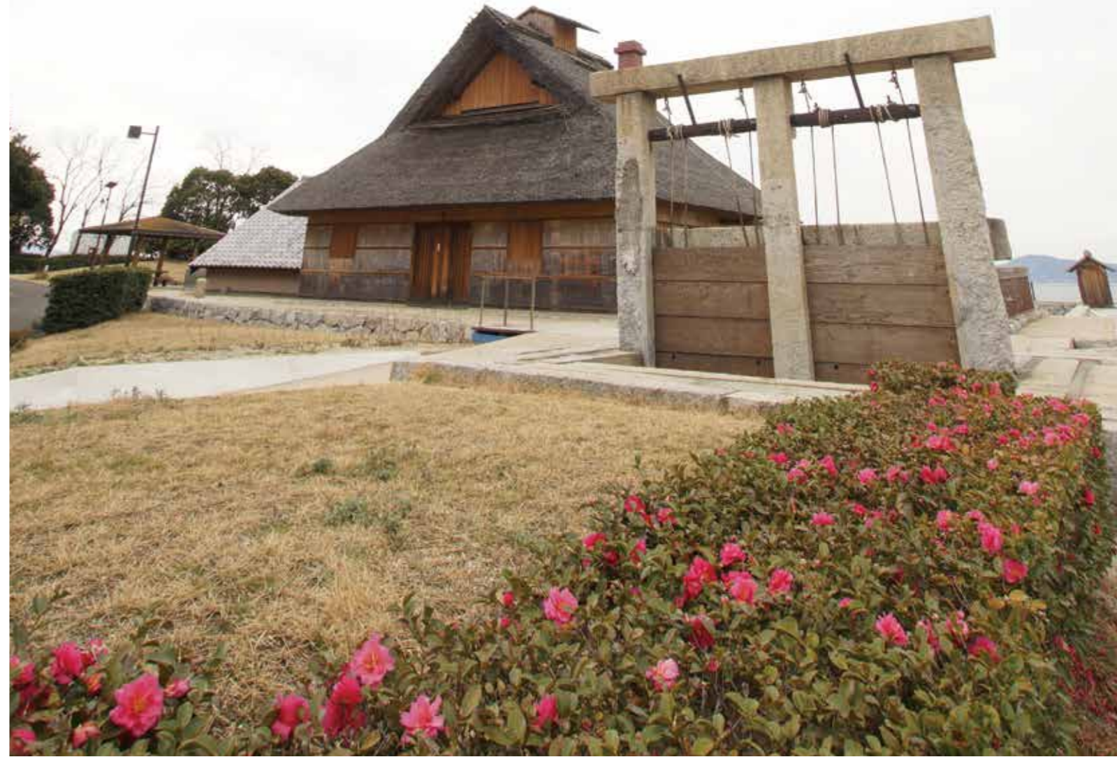
写真:復元塩田(香川県宇多津臨海公園)

が前日から煮込んだアキレスなど盛りだくさん♪そして準備段階から用意されていたメインドリンクはもちろんサーバーからの生ビール!レクリエーション部員は開始4時間前から会場(USE)に入りウェルカムドリンクを初め食材たちの毒見をしつつ準備を終えスタート。12月誕生日のお二人にはサプライズもありとても楽しい忘年会でした。