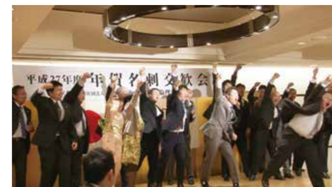
▲香川県普通寺琴平倫理法人会