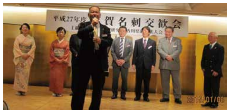
▲香川県丸亀市倫理法人会