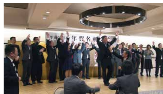
▲香川県高松東倫理法人会