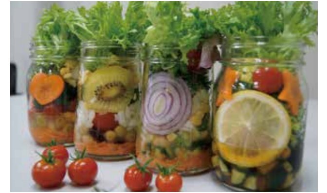
▲今流行のジャーサラダ、香川の野菜で作らしましょう。