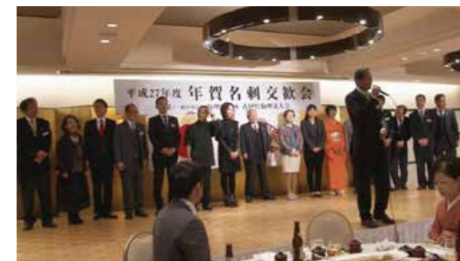
▲香川県さぬき市倫理法人会