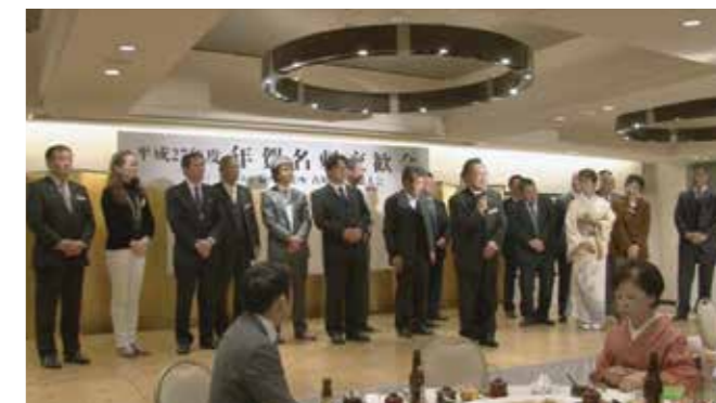
▲香川県高松南倫理法人会