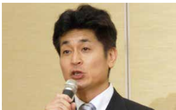
▲香川県高松市倫理法人会