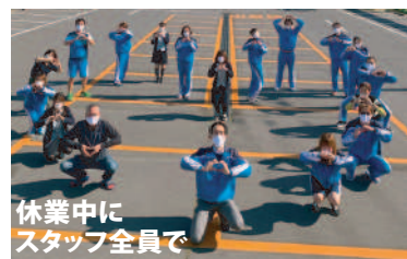
休業中にスタッフ全員で