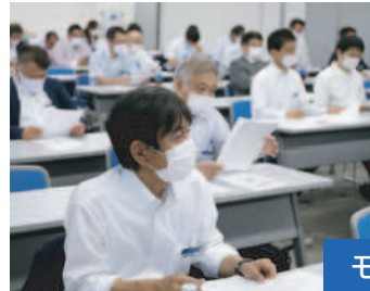
モーニングセミナー委員会

点に立ち明朗な心で実践の場を「皆で作る」為にも皆さまのご協力をよろしくお願い申し上げます。更なる“新”に挑みましょう。