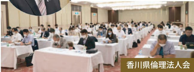
香川県倫理法人会