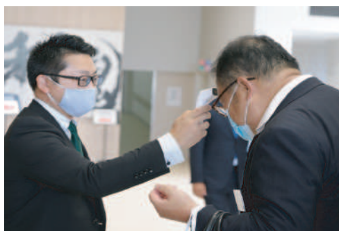
徹底した感染防止対策