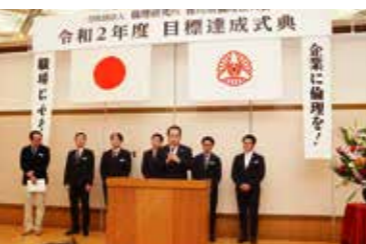
↑取り組み経過報告

かに活動をフォローされ、令和2年の年明け以降は「上下一心」に拍車をかけ活動に弾みがつき、見事に目標を達成する事ができました。式典後の懇親会は大変に盛況で、目標達成を祝して親睦を深めつつも、新入会員・入会歴の浅い方々へ「純粋倫理」を正しく理解していただくための研修会開催等、年度後半の『充』に向けた活動についても会員相互で活発な意見が交わされました。