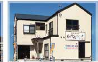
家族葬の花水木 あすなろリビング多度津