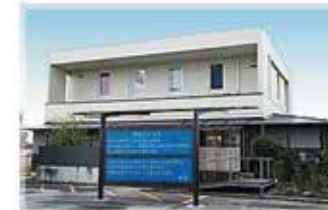
丸亀セレモニーホール花水木 郡家会館

どんな些細な事でも、遠慮なくご相談ください。 まごころ はなみずき 0120-056-873 24時間 365日受付