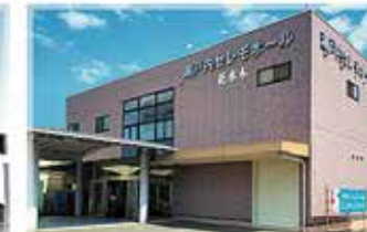
瀬戸内セレモニーホール花水木 坂出ホール