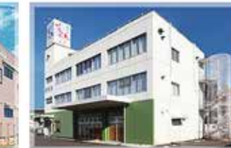
高松セレモニーホール 勅使成合ホール