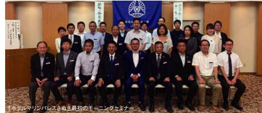
↑ホテルマリンパレスさぬぎ最初のモーニングセミナー

7人の会長を筆頭に役員のご尽力により、約3万人の人々をお迎えしました。特徴ある鏡張りの会場、名物の朝カレーともお別れになりました。