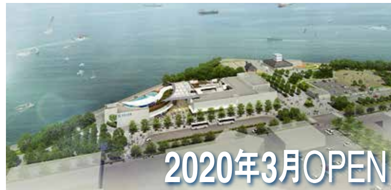
瀬戸の夕日を背景にイルカが躍る