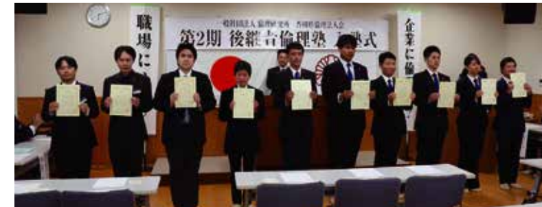
↑ 入塾証授与後、決意の表情に満ちた塾生