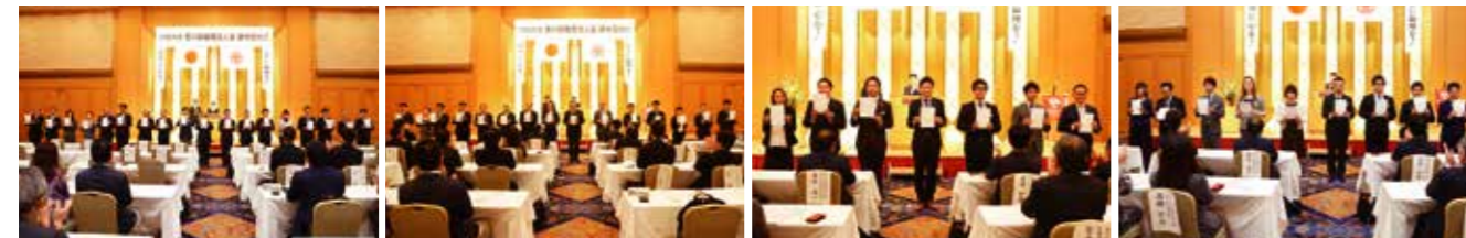
↑香川県 役職者辞令