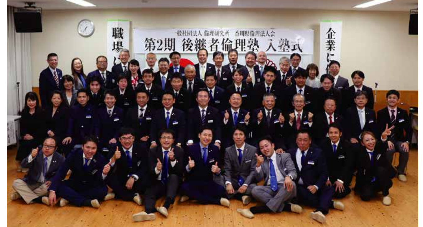
↑ 記念撮影 塾生及び入塾式参加者一同