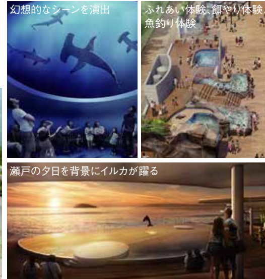
幻想的なシーンを演出

四方を海に囲まれ清流や湖沼など、四国ならではの水中世界をダイナミックに再現。時間帯や季節で変化する空間演出、地域文化を感じる空間演出を施します。四国の玄関口としての立地を生かし、四国各地の自然や地域文化とつながり、次世代に進化し続ける水族館。