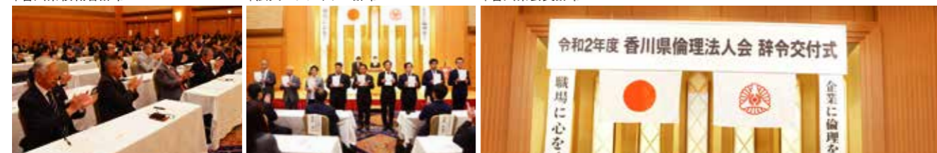
↑単位倫理法人会役職者辞令