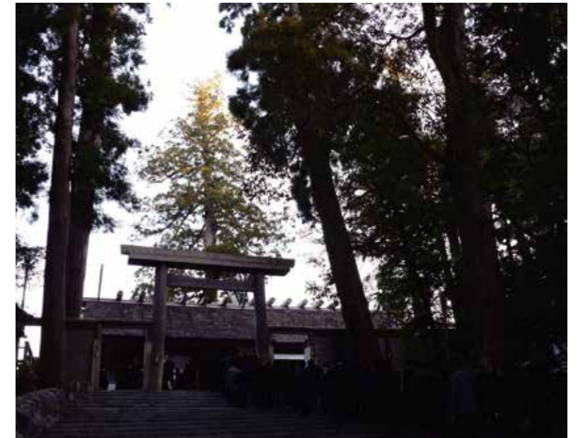
今回、この気づきを教えて下さった伊勢修養団の講師の先生方、共に研修に参加して頂いた塾長、運営委員の方々、後継者塾の仲間達に感謝致します。