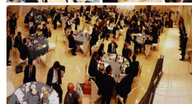
▲香川県後継者倫理塾一期生による朝礼実演