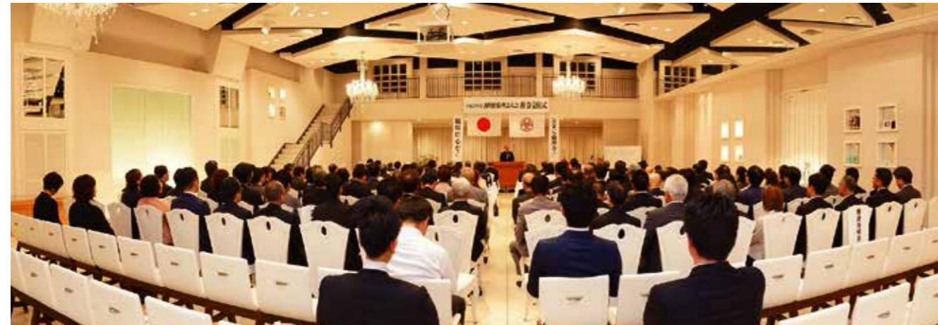
▲法人レクチャー辞令