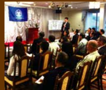
香川県さぬき市倫理法人会モーニングセミナー 平成30年9月14日(金曜日)