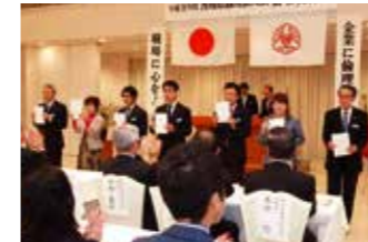
▲香川県東かがわ市倫理法人会