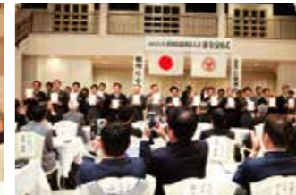
▲香川県高松南倫理法人会