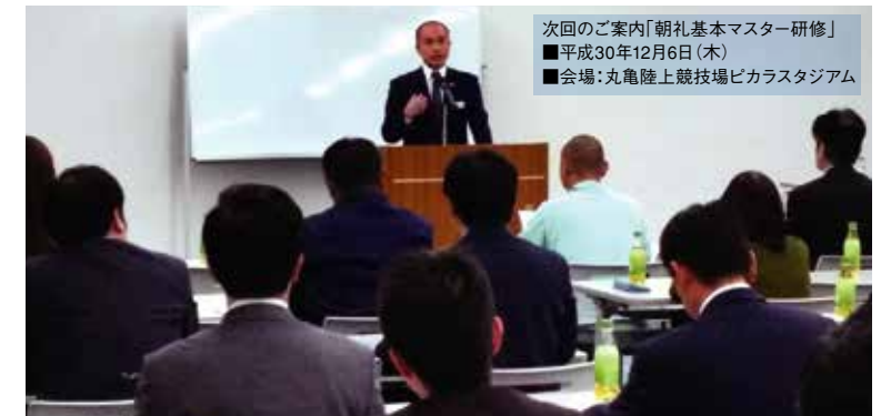
次回のご案内「朝礼基本マスター研修」 ■平成30年12月6日(木) ■会場:丸亀陸上競技場ピカラスタジアム

人に教えるとなった時、自分が思う以上に難しく、理解できていない事も意外に多い事に気が付いたのでと思います。