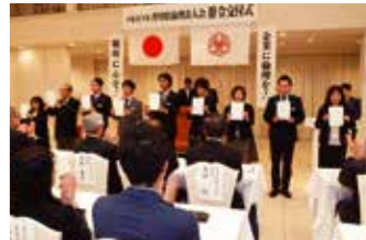
▲香川県高松三木倫理法人会