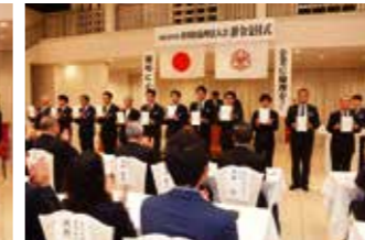
▲香川県坂出市倫理法人会