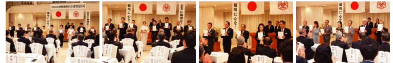
▲香川県丸亀市倫理法人会