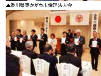
▲香川県普通寺琴平倫理法人会