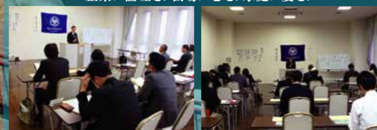
香川県高松三木倫理法人会モーニングセミナー 平成30年5月8日(火曜日)