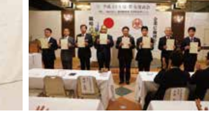
▲「目標会員社数達成表彰」