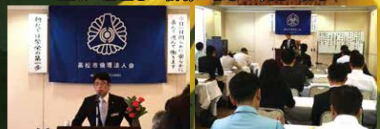
香川県高松市倫理法人会モーニングセミナー 平成28年7月29日(金曜日)