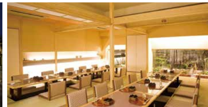
松縄別館: 松縄町1089-7 TEL:087-868-4612