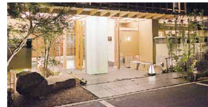
屋島本店: 高松町3005-4 TEL:087-841-7111