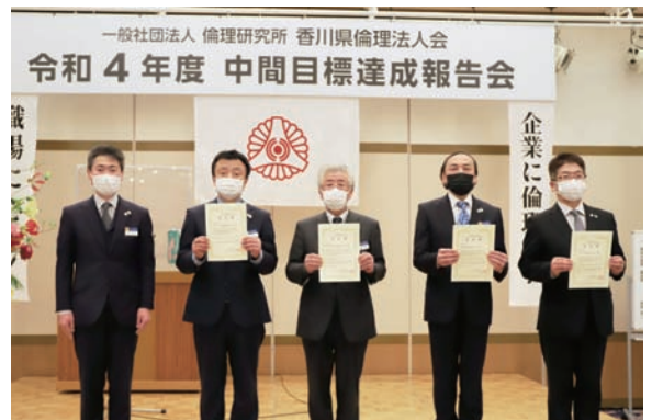
目標を達成された4単会会長を表彰