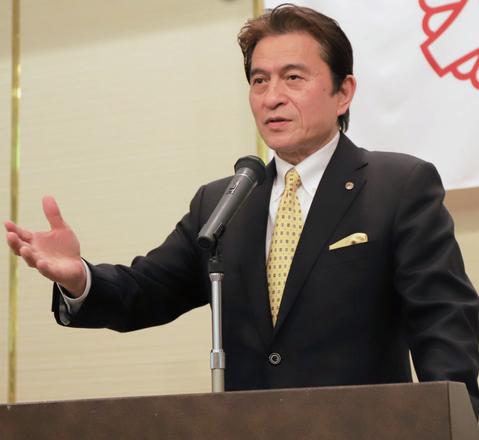
理事長役職者研修 2022. 4. 7 於：オークラホテル丸亀