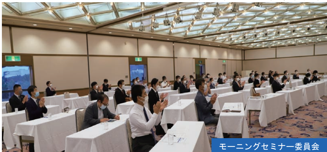
モーニングセミナー委員会