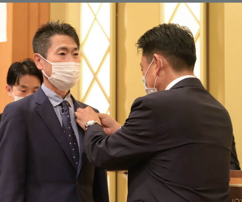
都道府県会長バッジの引継ぎ式