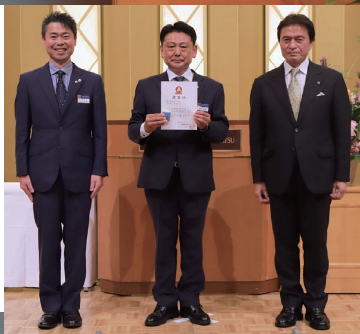
松熊前会長に感謝状の贈呈